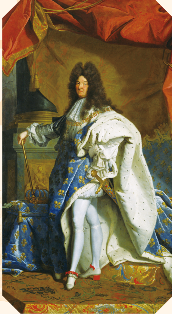
Louis XIV a.k.a le Roi Soleil