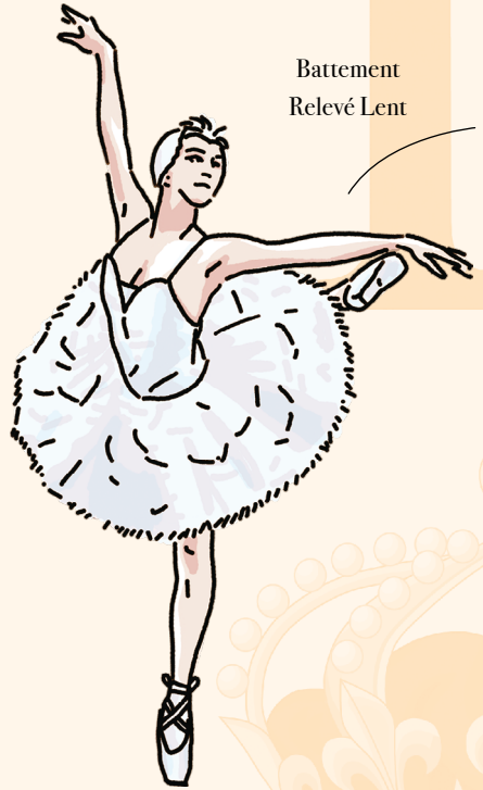
Battement Relevé Lent