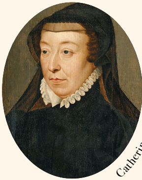
Catherine de' Medici