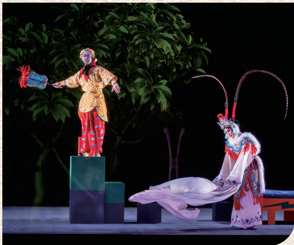
攝影 葉俊瑀、王俊凱